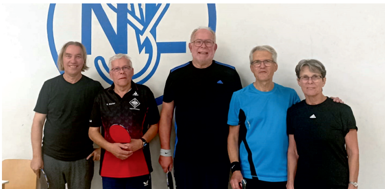
Auswärtsspiel der 2. Mannschaft beim SV Laufamholz