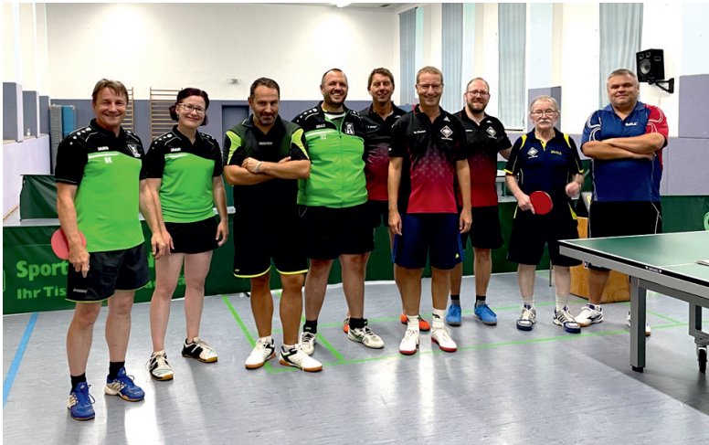
Auswärtsspiel der 1. Mannschaft beim TSV Mühlhof