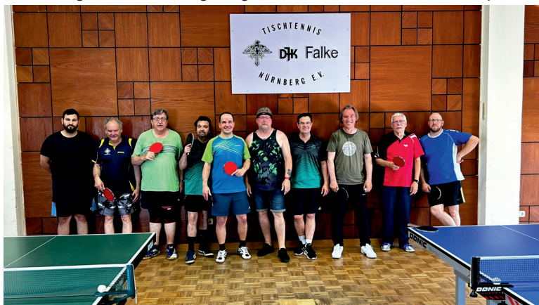
Freundschaftsspiel mit der DJK Concordia Fürth