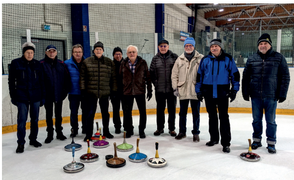
Die gesamte Mannschaft der Eisstockschützen