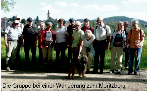
Die Gruppe bei einer Wanderung zum Moritzberg

Dabei hatten wir auch sehr interessante Erlebnisse und Ziele. Einmal in Großviehberg im Gasthaus hatte die Wirtin keine Bedienungen bekommen, sodass wir spontan das Schenken und Bedienen übernehmen haben und die Wirtin nur in der Küche war und kochte. Ein besonderes Ziel war die Osterhöhle bei Sulzbach-Rosenberg, die wir öfter ansteuerten.