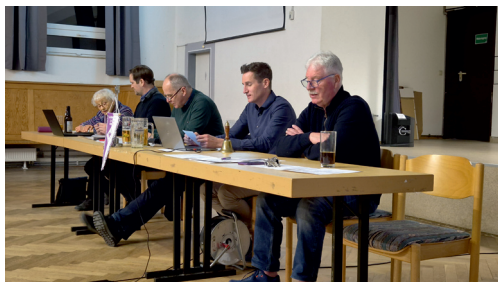
Die Vorstandschaft im Einsatz